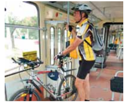
Za jízdy jednou rukou držte kolo, druhou držte vy. Kolo postavte řetězem ke stěně.