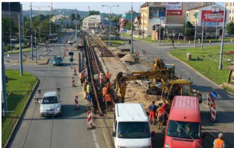
Opravy kolejí v křižovatce Sirkovce a Americké ulice.