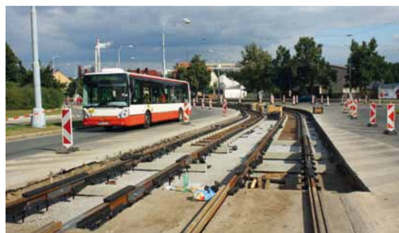
Rekonstrukce tramvajového oblouku v ulici Vejprnické a Terezie Brzkové.

V letošním roce probíhalo na tramvajové a trolejbusové síti značné množství výluk, a to jak z důvodu obnovy tratí, tak i z důvodu výstavby nové dopravní sítě na území města. Z těch nejvýznamnějších, které znamenaly pravidelné linky dlouhodobě, či opakovaně byly výluky v Mikulášské ulici a pod viadukty u hlavního vlakového nádraží, ve Vejprnické ulici v předních Skvrňanech a v téže ulici a ulici Terezie Brzkové v zadních Skvrňanech. Tyto výluky se dotýkaly zejména tramvajových linek. Pro provoz autobusových a zejména pak trolejbusových linek byla stěžejní vý-