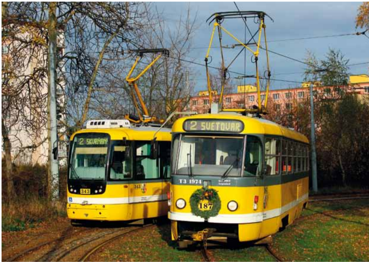
Symbolické střídání stráž: poslední odporová tramvaj z ČKD z r. 1974 se potkala se svou čerstvě modernizovanou nástupkyní na konečné v Zadních Skvrňanech při své poslední jízdě Plzni.

Mezi ostatními českými dopravními podniky vyniká ten plzeňský velikostí pravidelných investic do obnovy vozového parku. Kromě toho, že dnes již v plzeňské MHD převažují moderní nízkopodlažní vozidla, se Plzni podařilo dosáhnout i republikového prvenství v nasazení úsporných pohonů v tramvajové trati. Než Vám tento úspěch přiblížíme, prozradíme Vám ještě pár zajímavých údajů o vozovém parku PMDP.