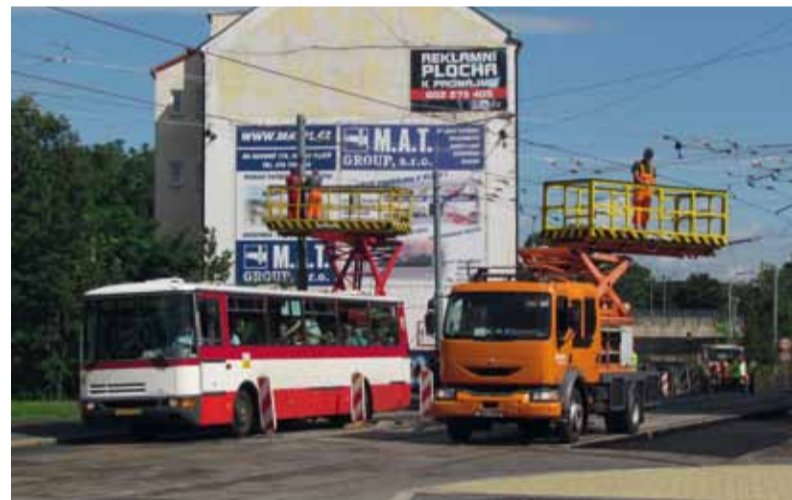
Na montáži trolejí spolupracovaly PMDP s firmou Elektroline. Místo tramvají jezdily autobusy, odkloněny byly i trolejbusy. 10. 7. 2012