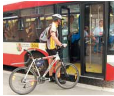
Nejprve se septejte řidiče, zda můžete nastoupit.

Pravidla pro přepravu jízdních kol podrobně popisuje článek 7 našich Smluvních přepravních podmínek , které naleznete například na webu www.pmdp.cz v menu Informace, ve vozídkách pak jejich stručný výtah.