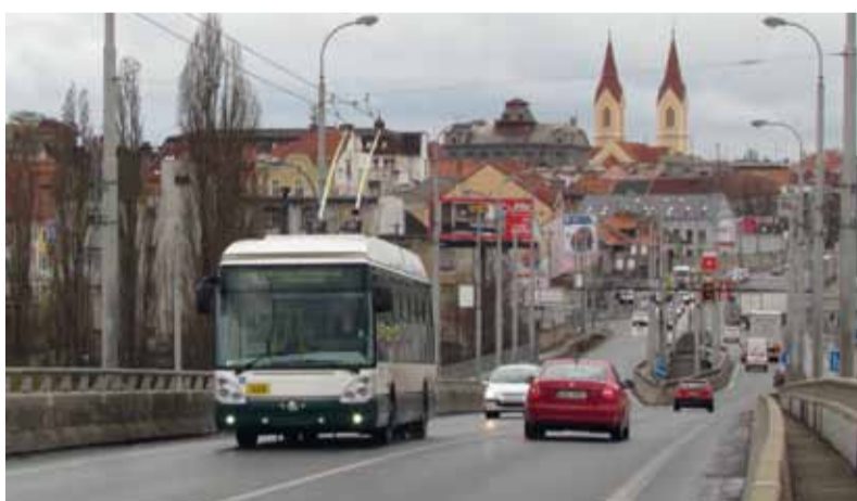
Od března 2012 trolejbusy využívají novou trasu přes most Milénia.