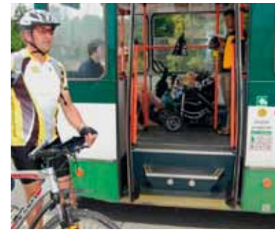
Pokud je ve vozidle kočárek nebo invalidní vozík, počkejte na další spoj.